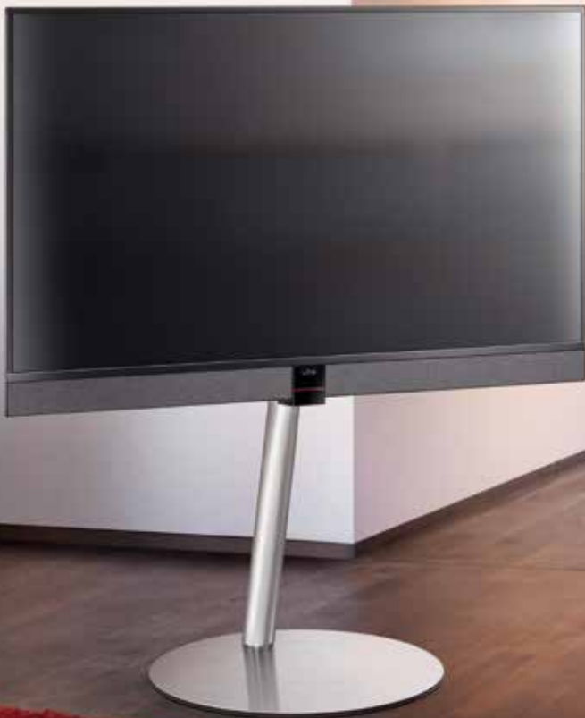
/ Beispiel Cubus auf dem eleganten Standrack